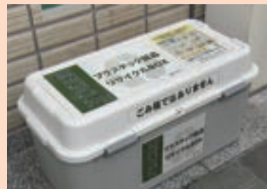
プラスチック製品リサイクル BOX