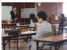
商工会議所女性会 市長と語る会