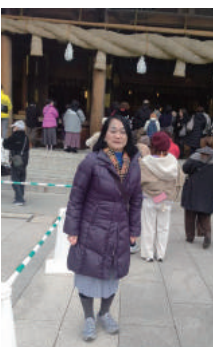
国道バス旅行 (寒川神社)