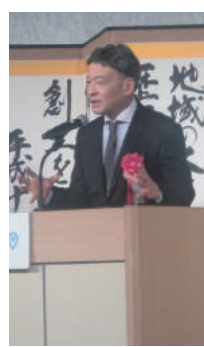
J C 賀詞交歓会