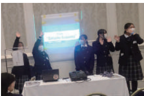
高校生探求学習発表会