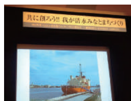
共に創ろう！ 清水みなとまちづくり