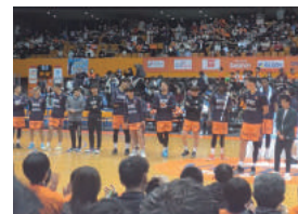
ベルテックス試合応援