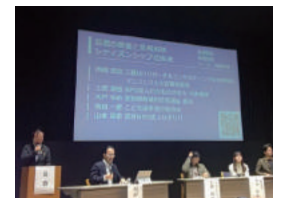
マニフェスト大賞 アワードコレクション