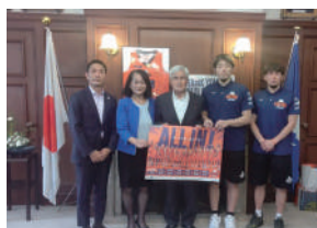
ベルテックス表敬訪問

(財) 大学女性協会公開シンポジウム「教育・ジェンダー・共生～ユースの視点から見直そう これからの日本～」に参加しました。静岡県立大学学生さんの「学生助けたいんじゃ～」のボランティア実践には大拍手を送りたいと思います。