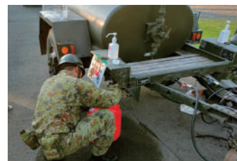
自衛隊員による給水活動