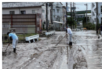
清水区鳥坂の被災状況