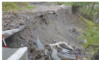
葵区口坂本の被災状況