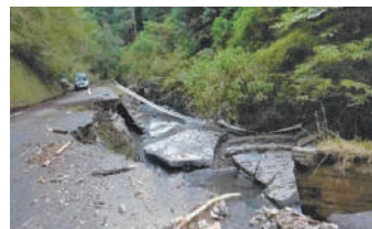
清水区河内の被災状況