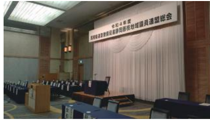
「高規格道路整備促進議員連盟総会」中部横断道も開通し、これからの交流が期待されます。