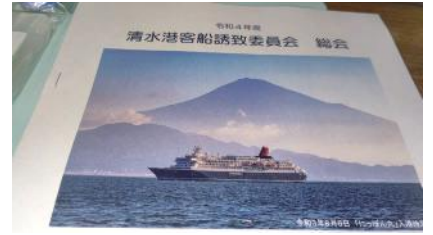
「清水港客船誘致委員会総会」コロナ禍ではありますが、これから少しずつ回復していきます。