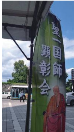
「聖一匠師 水まきの儀」をやらせていただきました。この水は博多どんたくで「勢い水」として使われます。