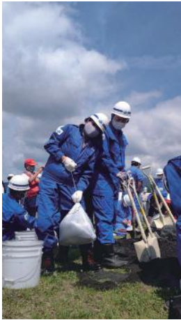
今年も水防訓練に参加。土嚢づくりがなかなかうまくなりません…