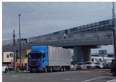
■歩道橋老朽化対応