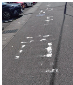
■小学校前の危険箇所