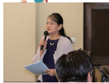
会派主催研修会 (今後の自治会活動のあり方について研修会を開催)