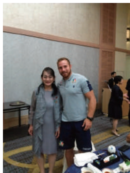
ラグビーイタリア代表チーム歓迎式典 (静岡市はイタリア代表の公認キャンプ地でした)