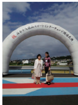
日本平・久能山 スマート IC 開通式典