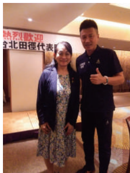
「静岡市・台北陸上大会」 交流事業代表歓迎会