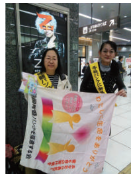
骨髄バンクキャンペーン (支援する全国超党派銀連盟が発足しました)