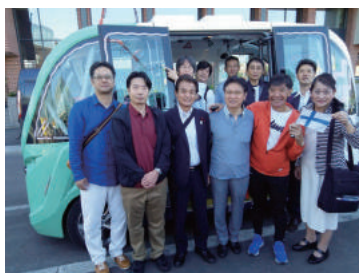
フィンランドヘルシンキ視察 (静岡市が導入検討している MAAS を視察。後ろはロボットバス)