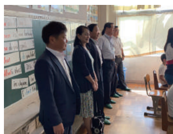
教育現場視察 (小学校の英語教育の現状や、中学校の部活動指導の現状を視察)