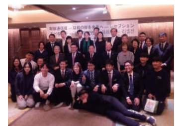
朝鮮通信使レセプション