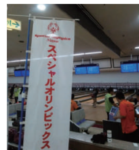
スペシャルオリンピックス