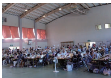
敬老会 (今年も盛大に開催されました)