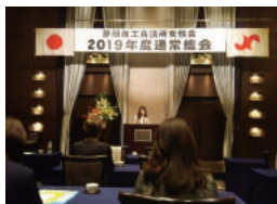
商工会議所女性会総会