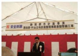
恩田原・片山土地区画整理事業基盤整備工事開始式典