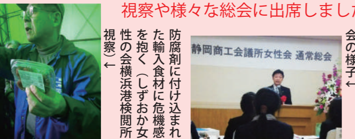
視察や様々な総会に出席しました