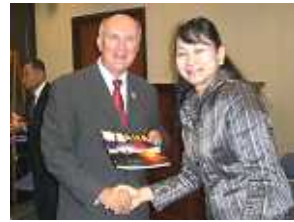
オマハ市長と握手