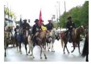
オマハならではのパレード