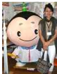
東京・隅田区のキャラクター