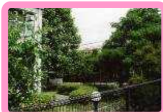
<<東源台児童クラブ(左)と校内建設予定地(右)>>