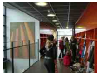
小学校の廊下には個人のロッカーが