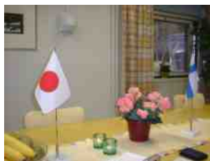
日本とフィンランドの旗がお出迎え

静政会の先輩議員から「我々のころは1年生議員は海外には行けなかった」と言われました。せっかくいただいたチャンスでした。しっかり視察してきました。遅れておりますが、後日報告します。(このチャンスも規制緩和かな?)