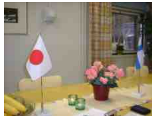
日本とフィンランドの旗がお出迎え

静政会の先輩議員から「我々のころは1年生議員は海外には行けなかった」と言われました。せっかくいただいたチャンスでした。しっかり視察してきました。遅れておりますが、後日報告します。(このチャンスも規制緩和かな?)