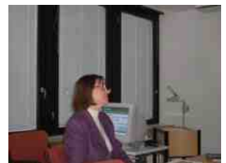
説明をする教育庁長