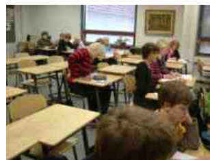
多くとも20人くらいの授業風景