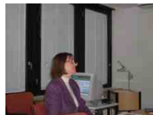
説明をする教育庁長