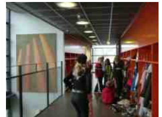
小学校の廊下には個人のロッカーが