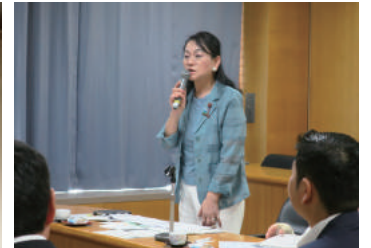
特別委員会視察 流山市

常任委員会意見交換会／女性管理職職員意見交換会／消防訓練／教職員定期大会／議会運営委員会／道路開通記念式典 高規格道路整備促進協議会／クルーズ船施策報告会／中部未来懇話会／デザインカレッジオープニング／各学校卒業式・ 入学式／太鼓練習会／地方議員研修会／経営戦略セミナー／各地いきいき教室／学区体育振興会／健全育成会理事会 中学校区地域運動推進会議／市長杯バレーボール大会／大学サークルOB会／かんぱ会／パパさんコーラス司会／商工会 議所女性会理事会／NPO法人理事会／華の会／コア会議／各地自治会総会／民放連／常任幹事会／各種女性団体総会 修善寺朗読会／木久学院講師／静響理事会／常葉大学公地域公開／藤の会／応援団フェスティバル その他