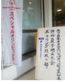
スペシャル オリンピックス