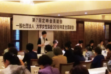
「女性大学協会」全国大会司会