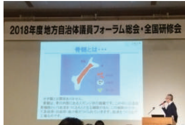
地方自治会議員フォーラム研修会