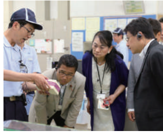
市長印刷局視察同行