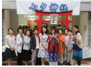
商工会議所女性会 「七夕神社」担当