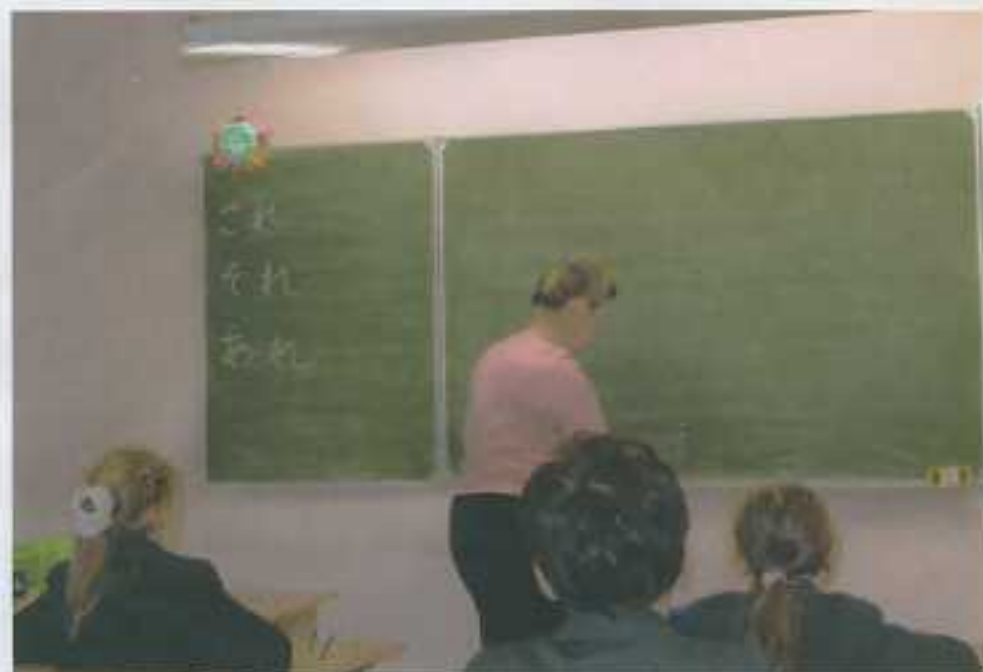
→ 日本より徹底した日本語教育の授業風景①