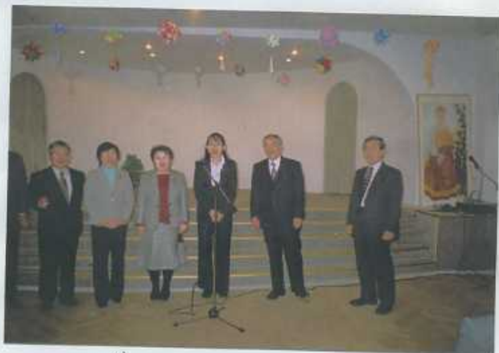
→ お返しに即興合唱団を結成