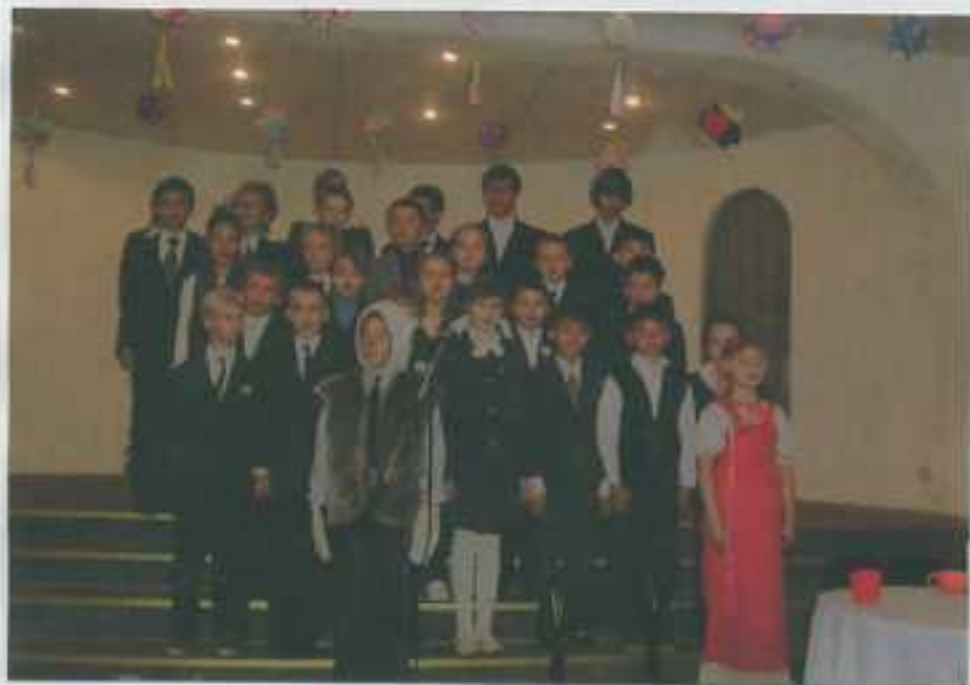
← 赤頭巾ちゃんの劇を日本語で