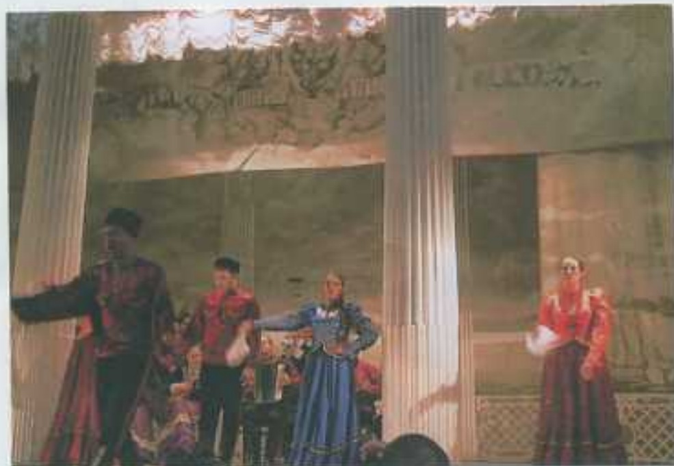
ロシア民族ショー一観賞→